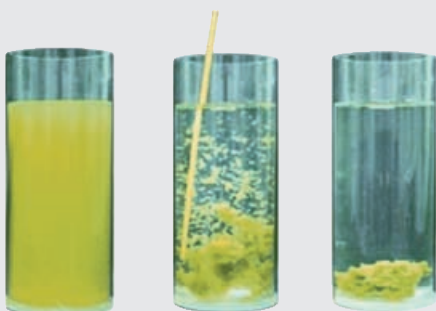
Flockung von gelösten Stoffen

Der Chlorverbrauch – und damit verbundene unerwünschte Chlornebenreaktionsprodukte – sinkt daher bei richtiger Flockungsfiltration mit Dryden Aqua um bis zu 80 %.