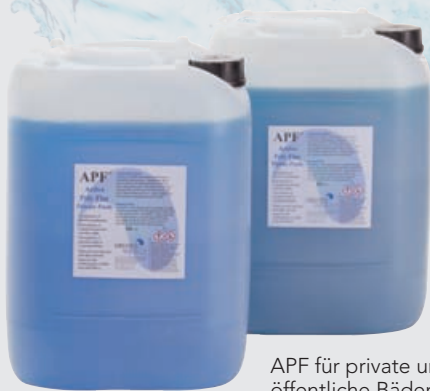
APF für private und APF für öffentliche Bäder